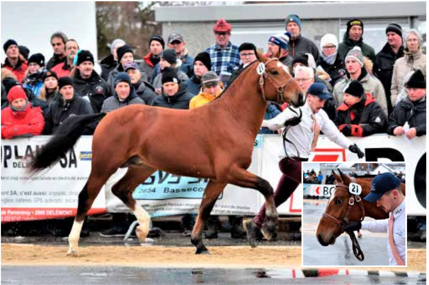
10. Platz: Vasari (Palace)