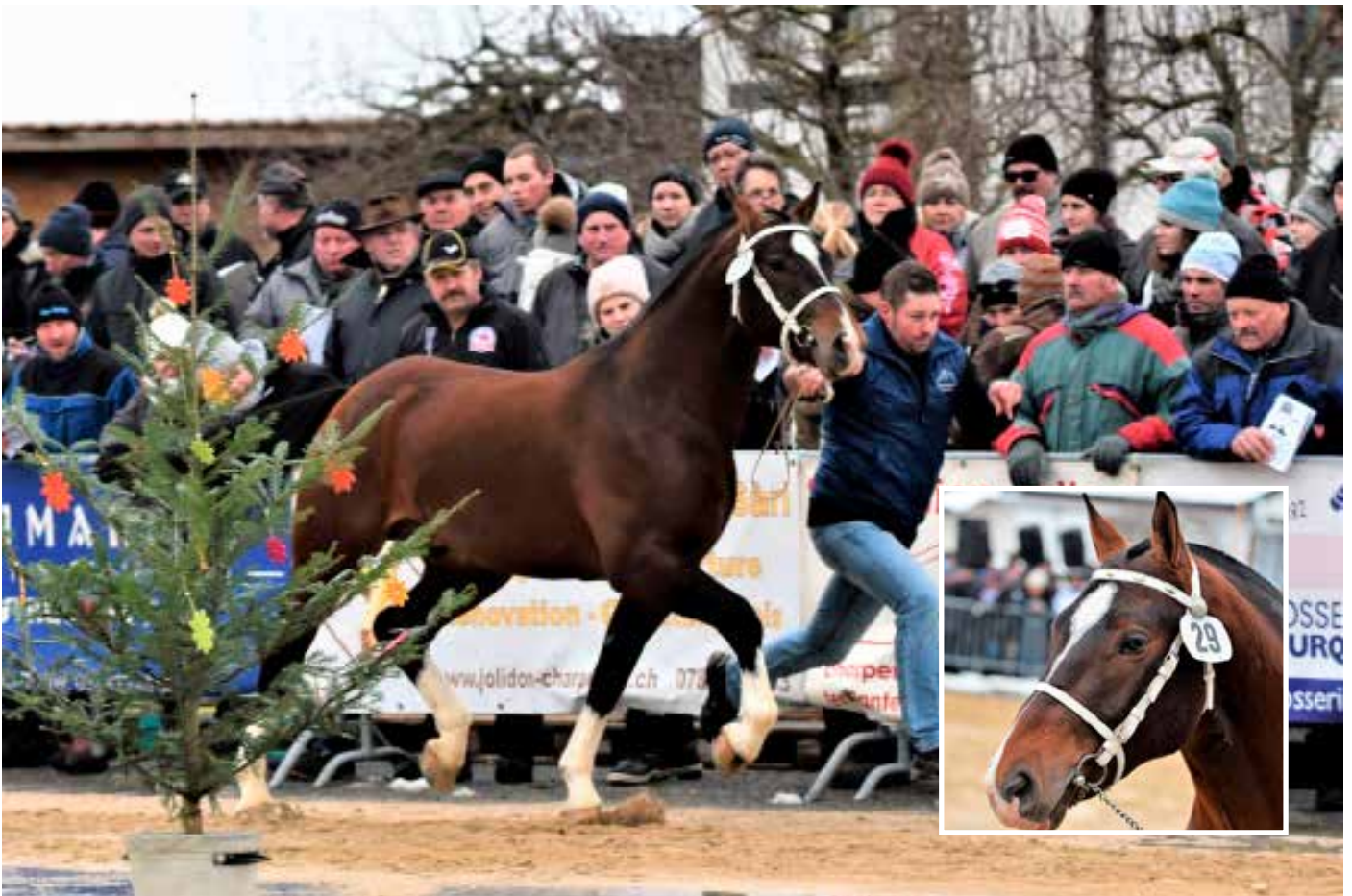
8. Platz: Lotus de la Vielle (Idem)