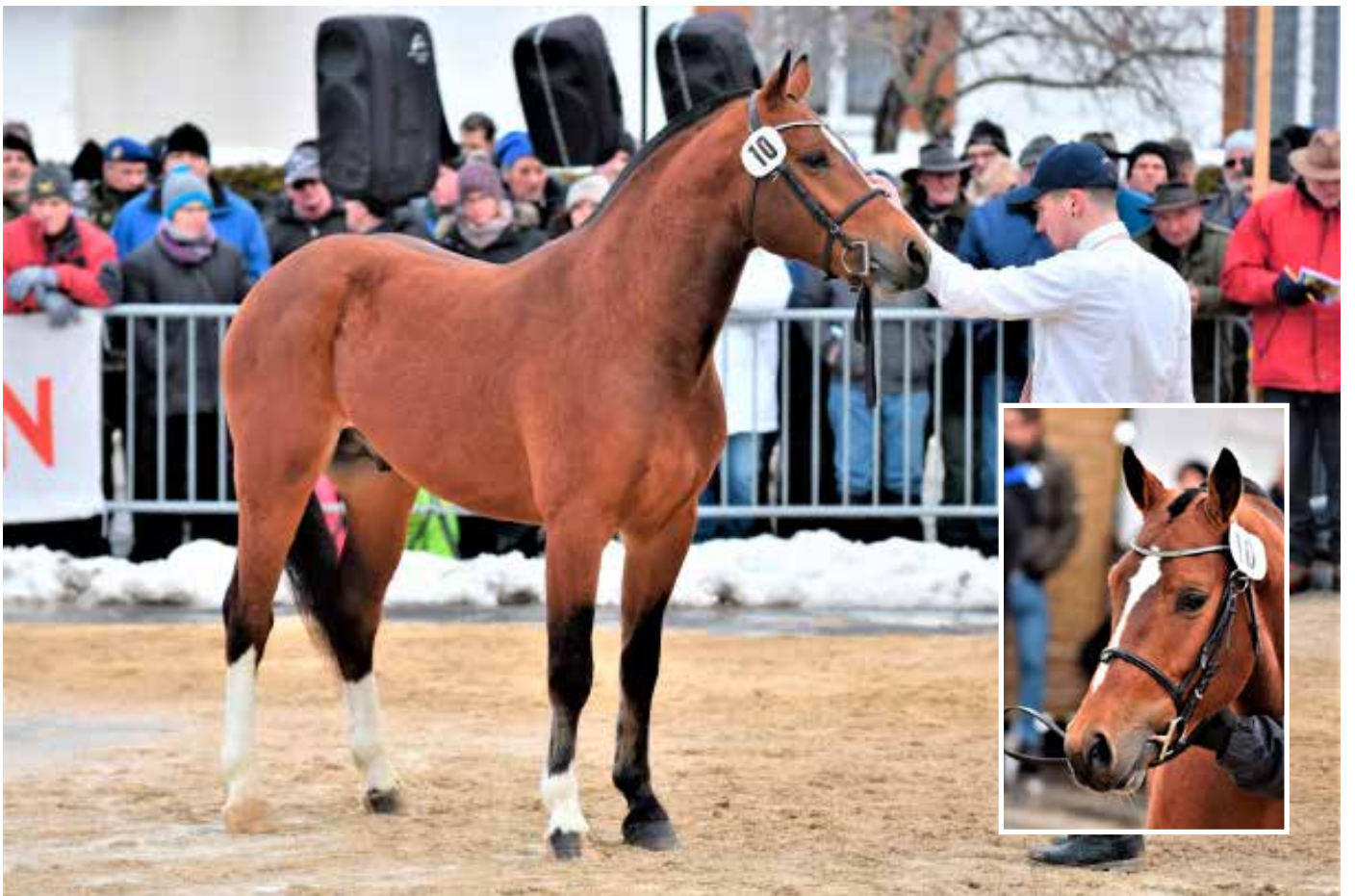
3. Platz: Kirikou de la Burgis (Nordica)