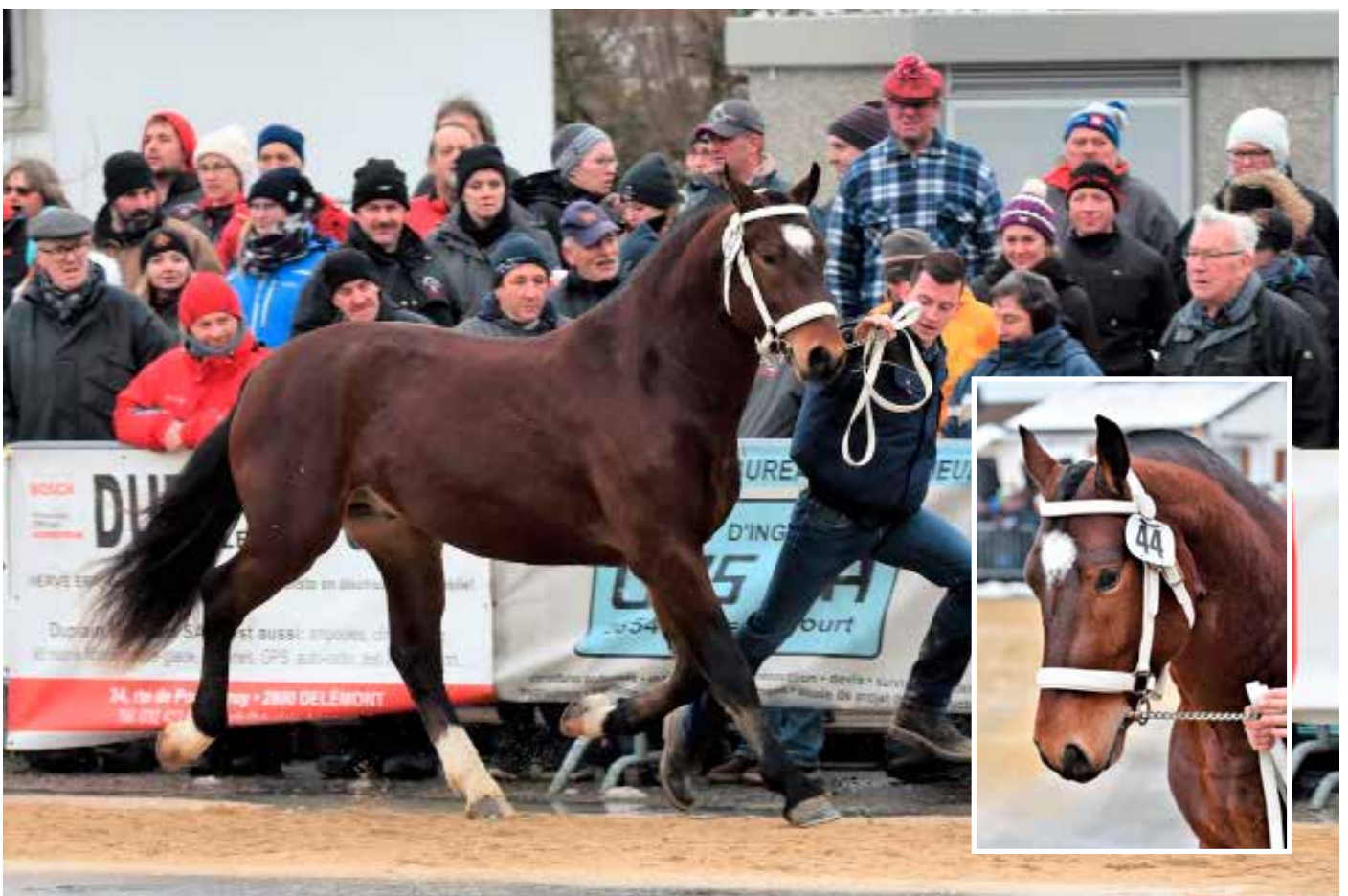
9. Platz: Camaro Shooting Star (Coldplay)