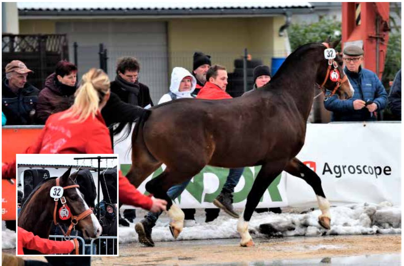
10. Platz: Horizon de Oués (Idem)