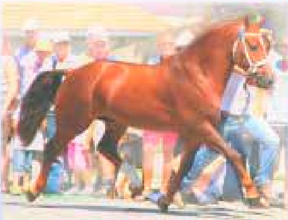
Hélixier: 0,39% Fremdblut Hermittage, Estafette, Rococo

u-klausch@t-online.de , 0176 32 38 10 70 05139/87131 nur TG-Sperma