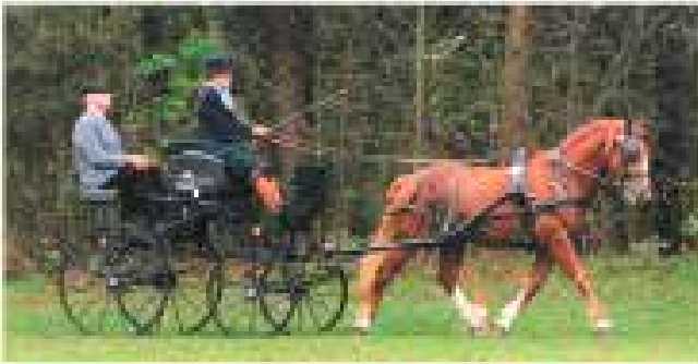
Dixan HA: (0%FB) Diger-Darius, Clair Val Erzo: (0%FB) Erzhard, Disco, Damien