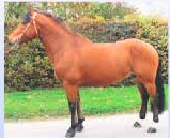
Vicky: 0% Fremdblut Va-et-vient, Judäa, Bouclier