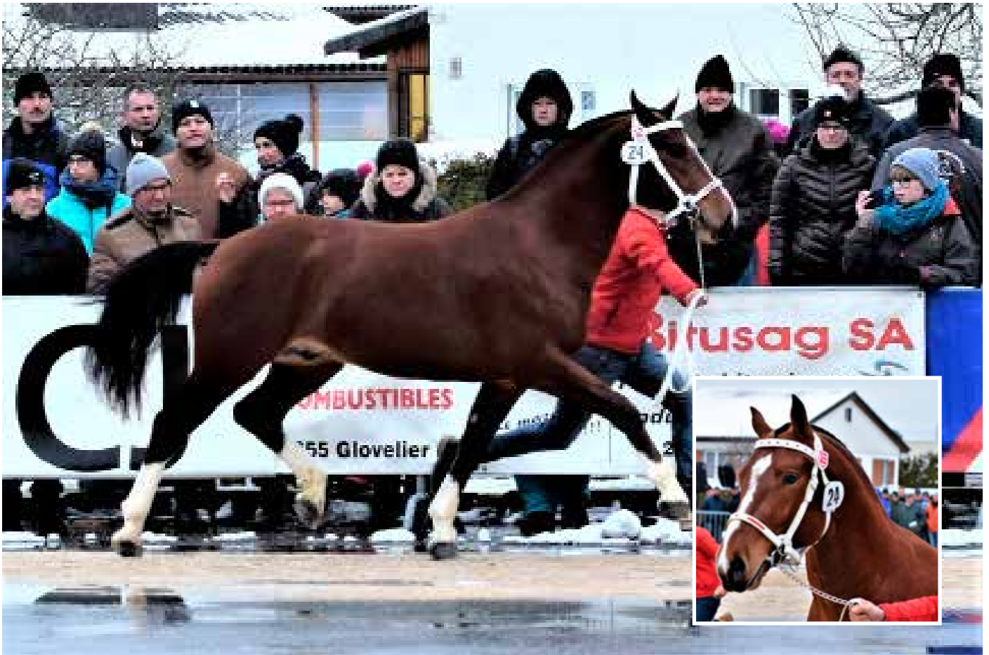
7. Platz: Limoncello (Idem)