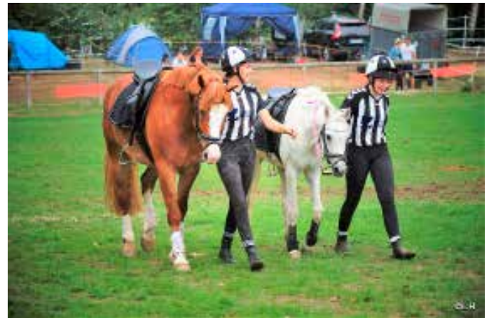
Trotz der spektakulären Einzelleistungen ist MG ein Teamsport

Unser erstes Turnier war ein Ranglistenturnier in Rendsburg, wo er sich sehr vorbildlich benahm. Für ihn war es ungewohnt, dass direkt neben ihm mehrere Pferde im vollen Tempo nach vorne galoppierten, aber er war wie immer konzentriert und artig bei mir. Bremsen war kein Problem, und das Auf- und Abspringen gelang auch. Beim Mounted Games gibt es auch sogenannte Übergaben, wo man seinem Teammitglied einen Gegenstand möglichst im Galopp übergibt. Das war für Highway ganz neu, aber das stellte kein Problem für ihn da. Mit seiner Größe und seinem Erscheinungsbild fiel er auf diesem Turnier sehr auf, denn alle anderen Ponys waren kleiner und schmaler gebaut. Aber sein großes Kämpferherz überzeugte, und andere Teams waren ebenfalls begeistert von dem kleinen. Denn es ist sehr wichtig das die Pferde klar im Kopf sind, was bei Highway definitiv der Fall ist.