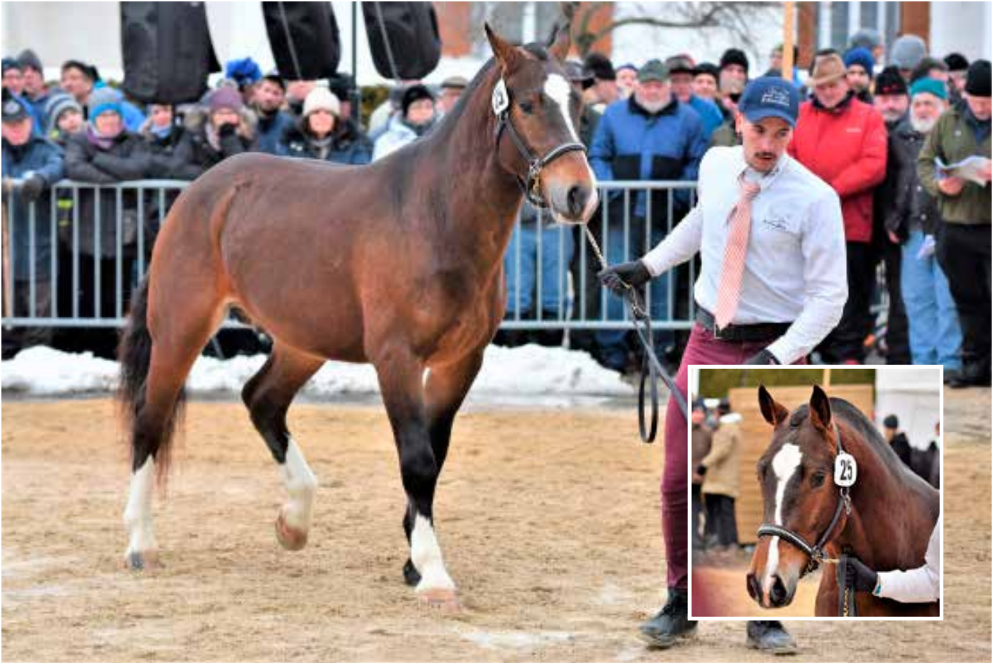
8. Platz: Caran d'Ache du Clos Virat (Idem)