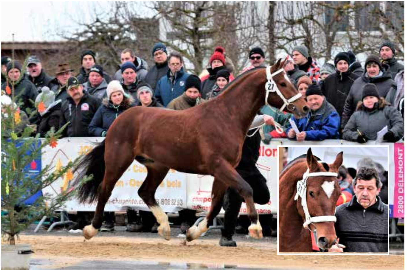
5. Platz: Nike (Idem)