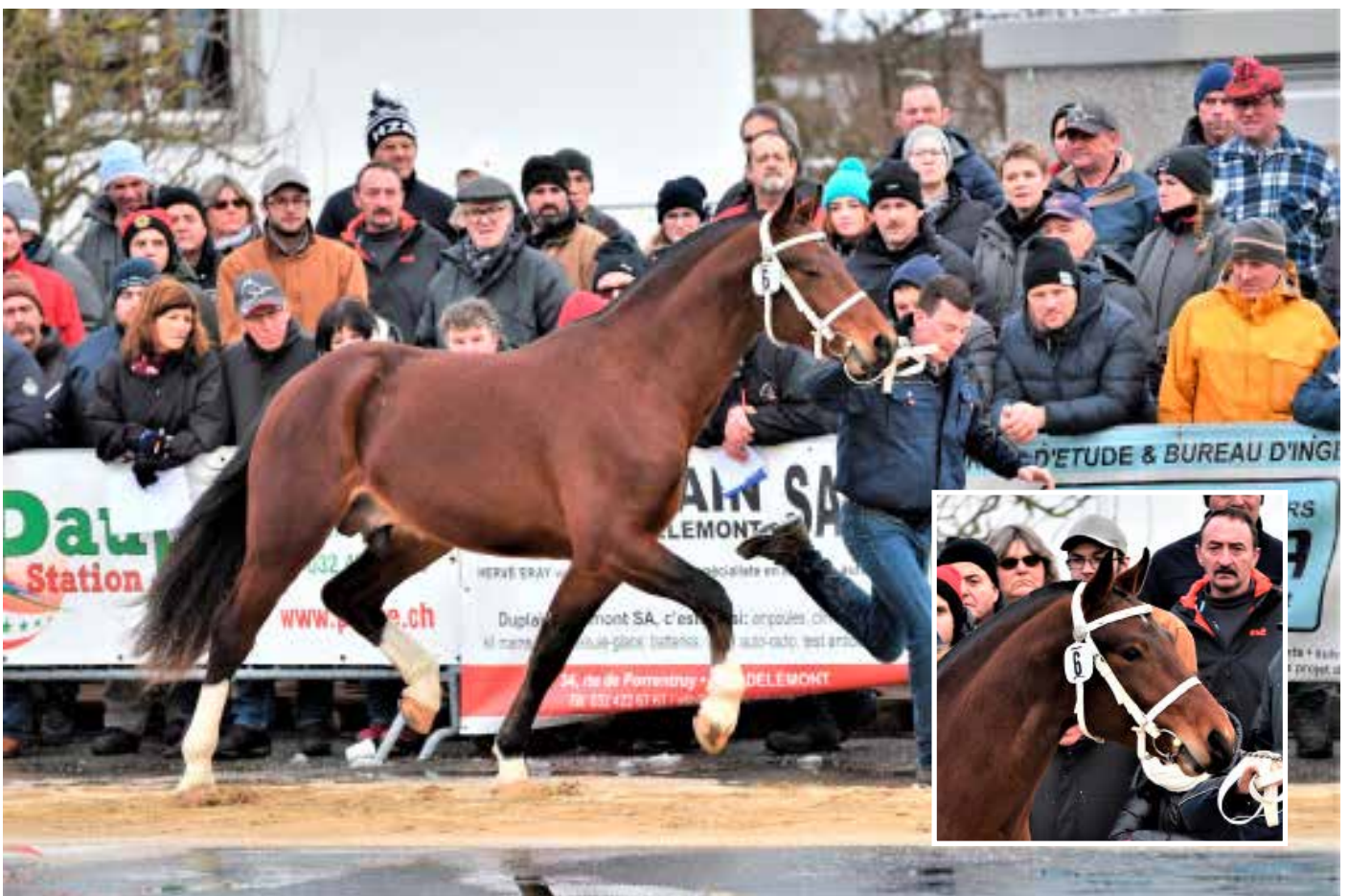
6. Platz: Nemo FW (Naska)