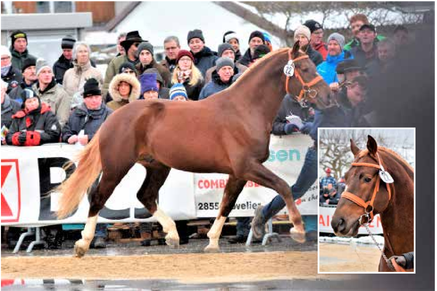
2. Platz: Petit Coeur Caramba (Capéo)