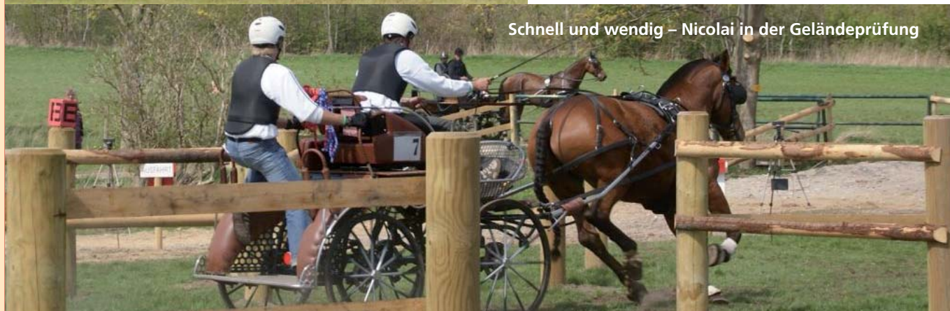
Schnell und wendig – Nicolai in der Geländeprüfung

Aktuelle Informationen finden Sie unter: www.roflexs-fahrteam.de und unter www.zugpferd-luhmuehlen.de