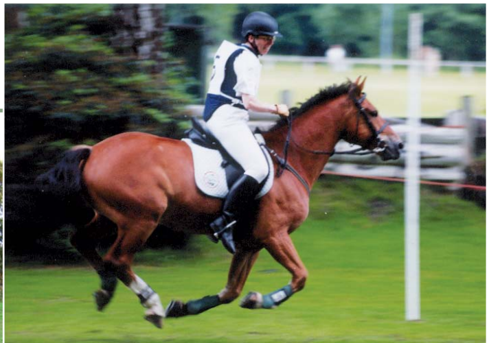
2002: Kaltblutrennen in Rastede

Wie sieht das Training aus – fürs Pferd und für Sie? Und wie vereinbart man einen Vollzeitjob, Haus, Garten und Training zeitlich?