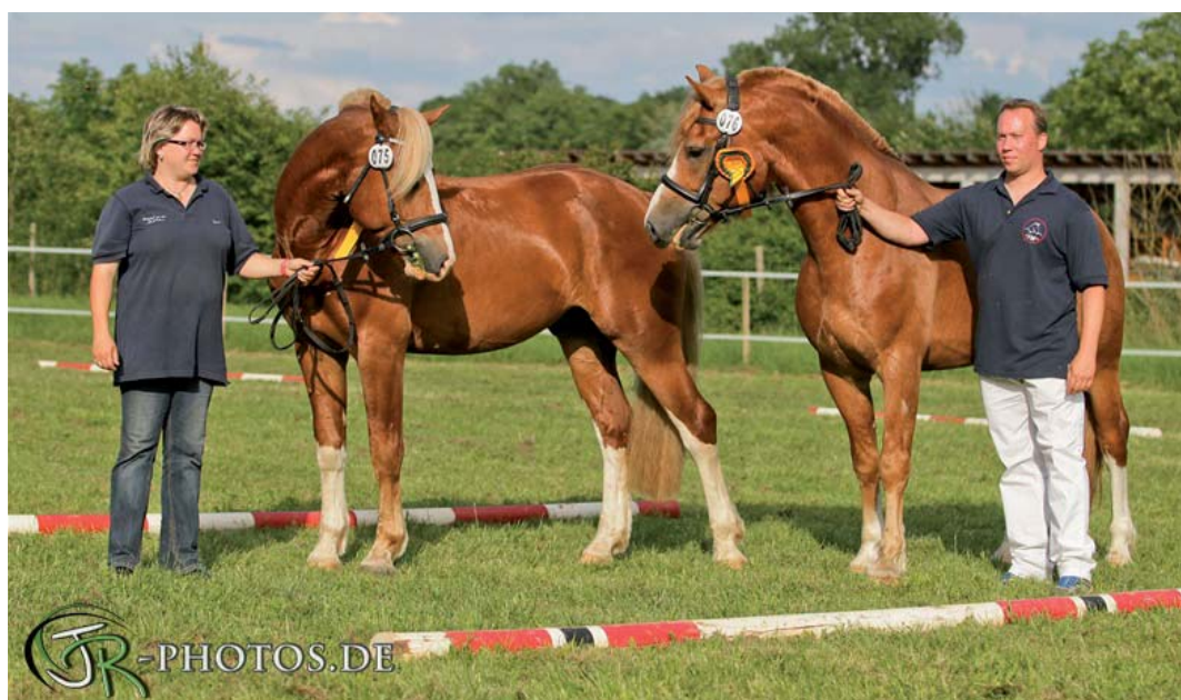
Die Freiberger Hengste Rico v. Hamlet des ronds Prés a. d. Diana und Trevis v. Nolo a. d. Stella