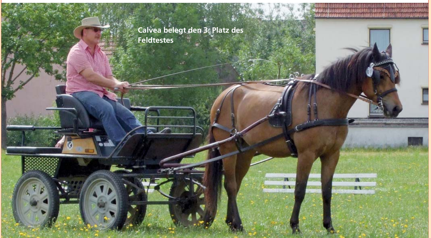
Calvea belegt den 3. Platz des Feldtestes