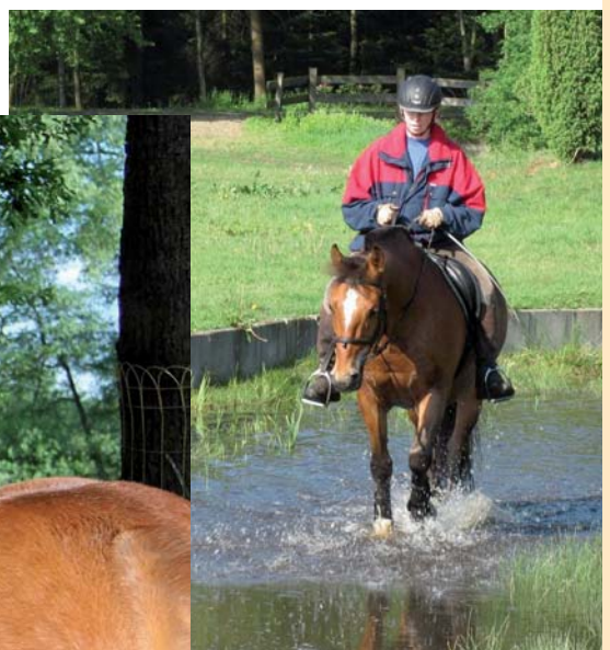
2011: Urlaub in der Lüneburger Heide

In Australien den Birdsville Track reiten, mehr als sechs unvergessliche Wochen lang treiben die bekanntesten und erfahrensten Viehtreiber des Landes 600 Stück Vieh mit Hilfe von Pferden den legendären, mehr als 500 Kilometer langen Birdsville Track entlang und lassen damit einen der faszinierendsten Viehtriebe der Welt alle 2 Jahre wieder aufleben. Die restliche Zeit brauche ich dann zur Erholung. Wenn dem Geld kein Limit gesetzt wäre, würde ich ein Anwesen in Australien suchen/kaufen, auswandern und eine Freibergerzucht aufbauen. ■