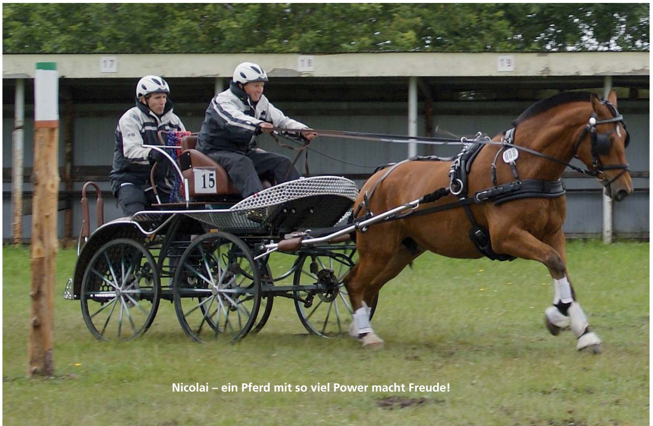
Nicolai – ein Pferd mit so viel Power macht Freude!