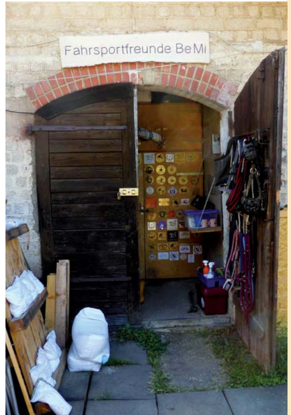
Die Futter-, Sattel- und Trophäenkammer