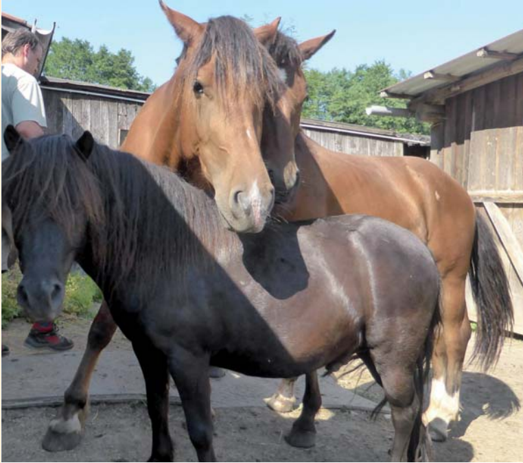
Das kleine Shetty ist immer und überall dabei