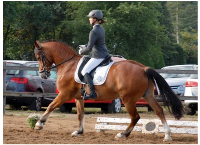
... versammelt im Galopp