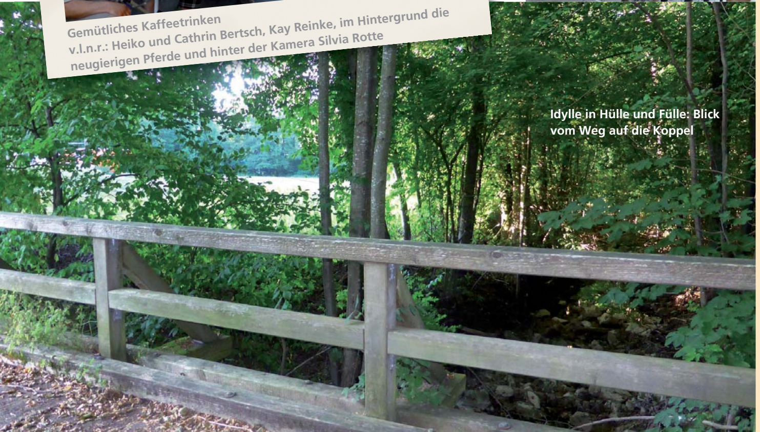
Idylle in Hülle und Fülle: Blick vom Weg auf die Koppel