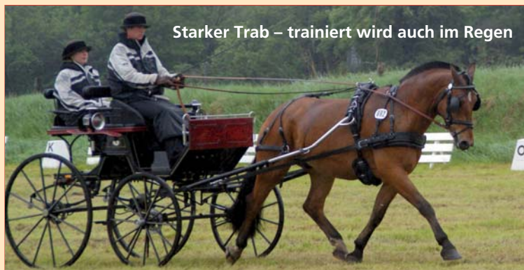
Starker Trab – trainiert wird auch im Regen

Aktuelle Informationen finden Sie unter: www.roflexs-fahrteam.de und unter www.zugpferd-luhmuehlen.de