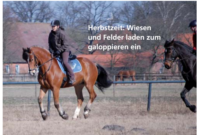
Herbstzeit: Wiesen und Felder laden zum galoppieren ein