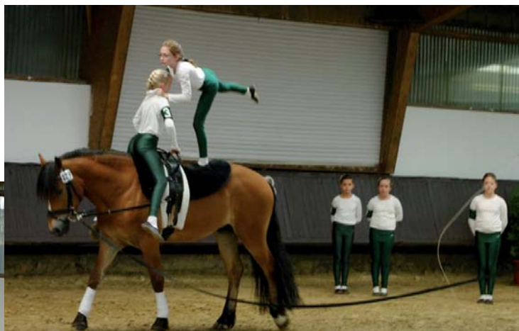
In der Kür sind fast immer zwei Kinder auf dem Pferd

Die ersten „Erfahrungen“ als Voltigierpferd liegen gerade mal knapp ein Jahr zurück. Damals begann er langsam seine Aufgaben in diesem Bereich des Reitsports zu lernen. Ab Herbst übernahm er dann die Trainingsstunden mit zwei Kindergruppen des ZRG St. Sebastian Amelsbüren. Seine Mutter Tina (Henderson/Deli) sollte sich auf ihre Aufgabe als werdende Mutter konzentrieren.