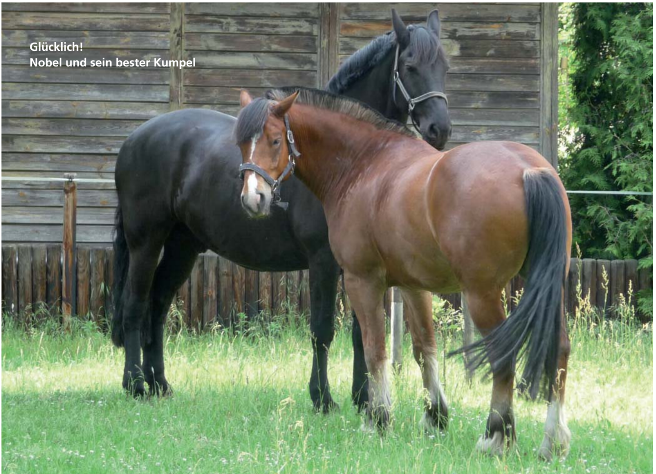
Glücklich! Nobel und sein bester Kumpel