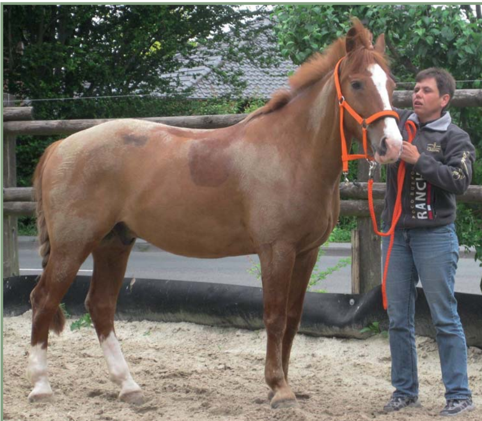
Nach langen Anreisen zum Veranstaltungsort liebt Asterix es, sich ausgiebig zu wälzen