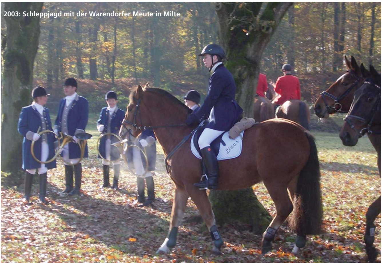
2003: Schleppjagd mit der Warendorfer Meute in Milte

Da ich, wie schon angedeutet, im Herbst auch Schleppjagden mit Linus reite, ist die Saison für ihn sehr lang. Auf dem Hof wo er jetzt steht, gibt es nur eine kleine Halle, die uns beiden zum Reiten zu klein ist. Diese nutze ich im Winter allerdings nur, wenn das Wetter es nicht anders erlaubt, aber nur zum Freispringen oder Longieren. Ansonsten gehe ich bei jedem Wetter ins Gelände, auch bei Dunkelheit. Dann sehen wir zwar mit den ganzen Beleuchtungen aus wie ein Weihnachtsmann, aber es dient