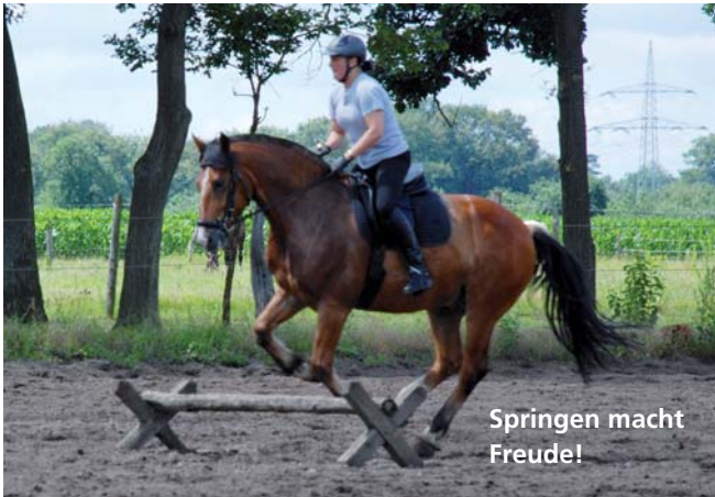
Springen macht Freude!