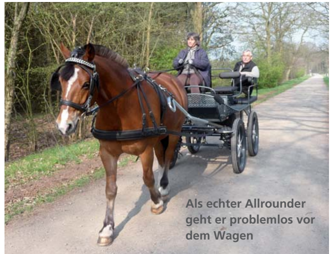
Als echter Allrounder geht er problemlos vor dem Wagen

Als wir unser Weihnachtsreiten vorbereiteten, zeigte mir Nobel mal wieder ganz deutlich, was für ein schlauer Kerl er ist. Wir waren eine bunte Stallquadrille und nach nur zwei Trainings-