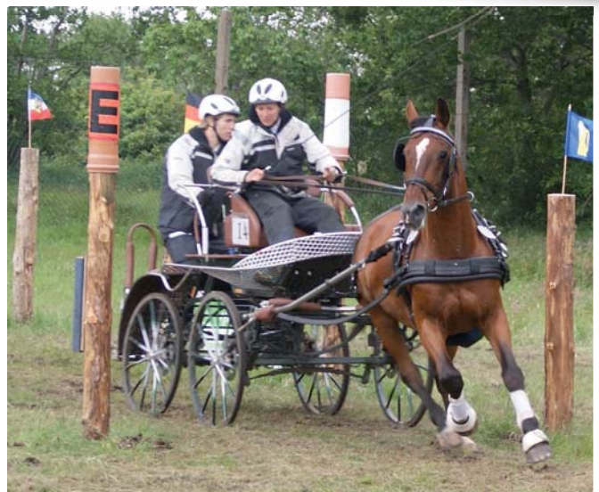
Chico in Hindernis 1