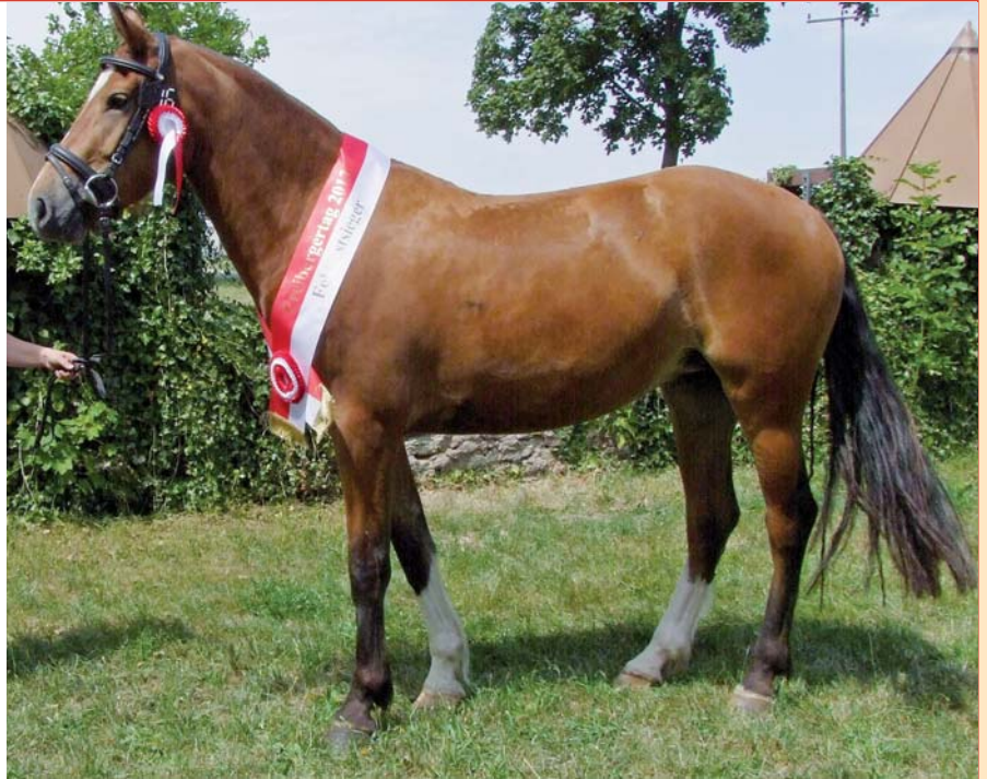
Siegerstute des diesjährigen Feldtestes: „Riha“