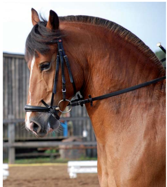
Der 7-jährige Nobel: Ein Pferd mit Ausstrahlung

Vielen Dank lieber Nobel, dass wir mit dir so viele schöne Stunden erleben dürfen.