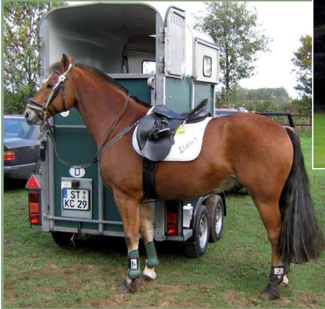
2006: Schleppjagd in Ladbergen mit der Cappenberger Meute