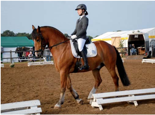
Nobel und Vivienne im Dressurviereck