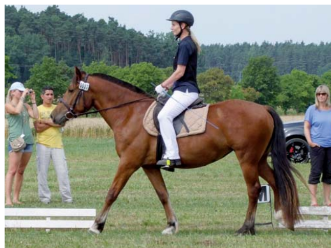
Bailey meistert die Reitprüfung souverän und sichert sich den 2. Platz