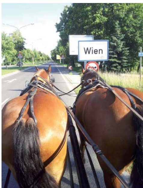
Wien – in die Stadt der Fiaker fahren gelassen zwei Freiburger ein

Wir steuerten Richtung McDonald auf die Brünner Straße zu. Der Gastgarten war übervoll mit Besuchern und bei dem Hufgeklapper wurden die Gäste auf uns aufmerksam. Erstaunen machte sich breit, als wir in den McDrive-Bereich einfuhren und viele Kinder und natürlich auch Erwachsene zückten ihre Handys und fingen an zu fotografieren, als wären wir mit unseren Pferden Filmstars. Eros und Negri blieben überall brav stehen damit wir bestellen konnten, es dauerte allerdings ein wenig bis wir zum nächsten Schalter weitergeleitet wurden. Dort ging es ans Bezahlen, was wiederum kein Problem darstellte, für uns und die Pferde, allerdings wurde uns von einem sehr freundlichen Angestellten