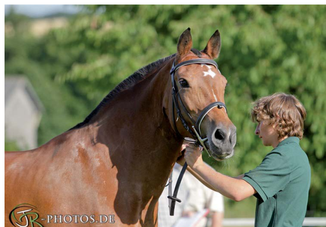
Die sportive Siegerstute bei den Freibergern: StPrSt Xena v. Eidgenoss a. d. VPrSt Marlot, Besitzer: Robin Mussel aus Wörrstadt