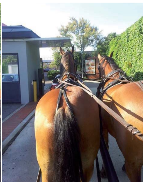
Mit 2 PS in den Drive-In, ein sicherlich nicht alltägliches Vergnügen